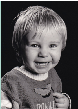
Yngste 2R hører nu også til blandt Yngste i børnehaven på Skovvej

På grund af de nye afsløringer har hotelværtten meddelt at hans fødselsdags-fest er udsat til senere på året, men at Hotellet selvfølgelig er åbent på dagen.